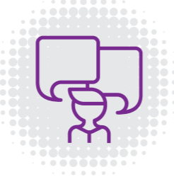
Gerichte en effectieve feedback